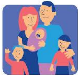
KARTA DUŻEJ RODZINY

c) na żywienie dzieci i młodzieży wydatkowano kwotę ogółem 666,69 zł z czego 0,00 zł stanowią środki własne. Dożywianiem objęto 9 dzieci,