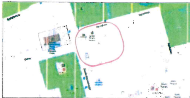
Położenie obszaru opracowania