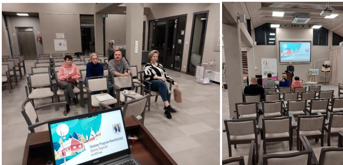
Ryc. 7. Zdjęcia z debaty w dniu 21 listopada 2024 r.