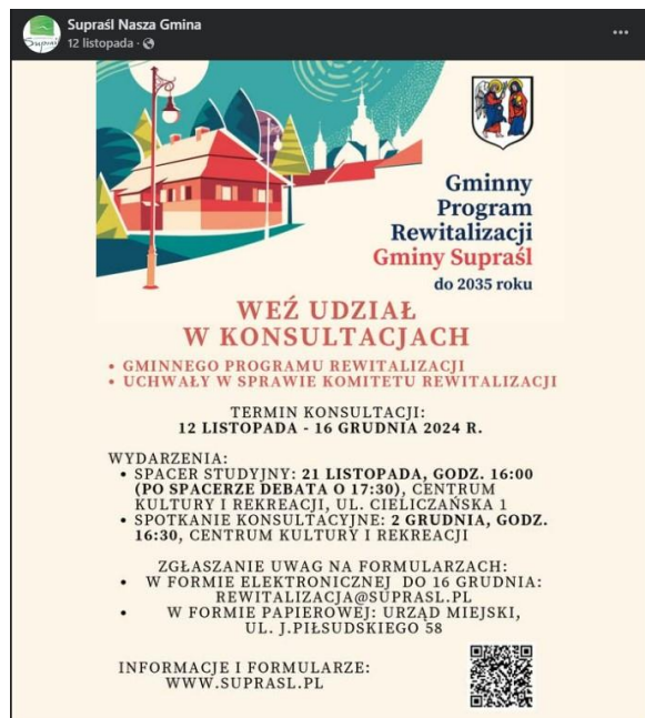
Ryc. 5. Informacja o rozpoczęciu konsultacji społecznych na profilu Facebook gminy Supraśl